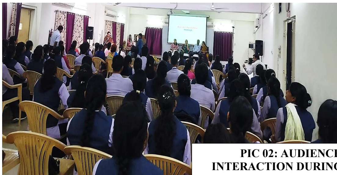
PIC 02: AUDIENCE INTERACTION DURING THE Q&A SESSION