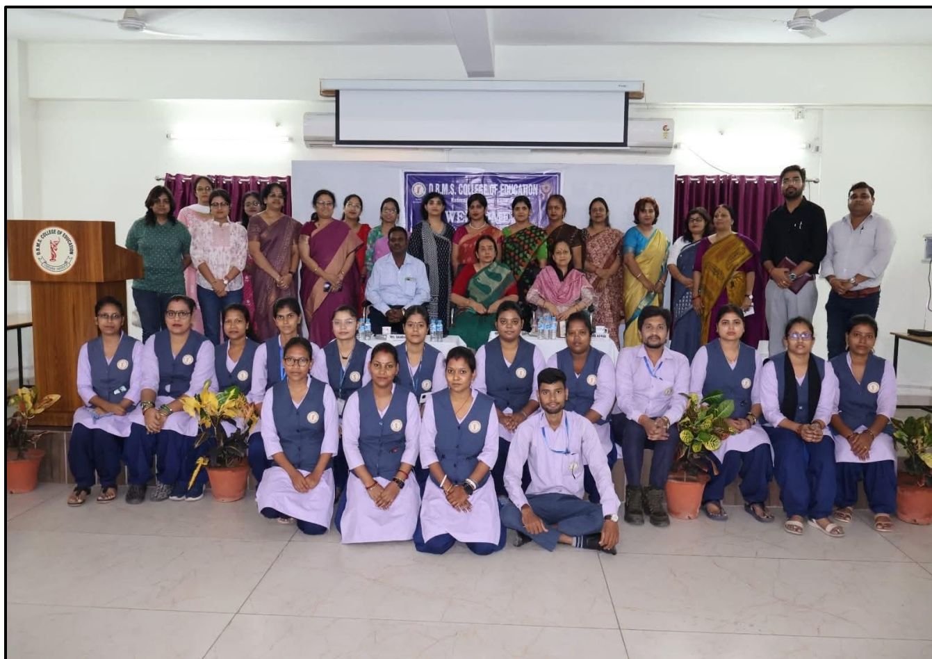
Pic 03: GROUP PHOTO WITH DIGNITARIES AND FACULTY

E-mail : dbms.edu23@gmail.com | Website : dbmscollege.in