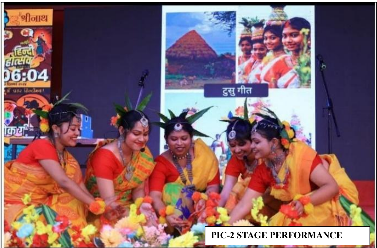
PIC-2 STAGE PERFORMANCE