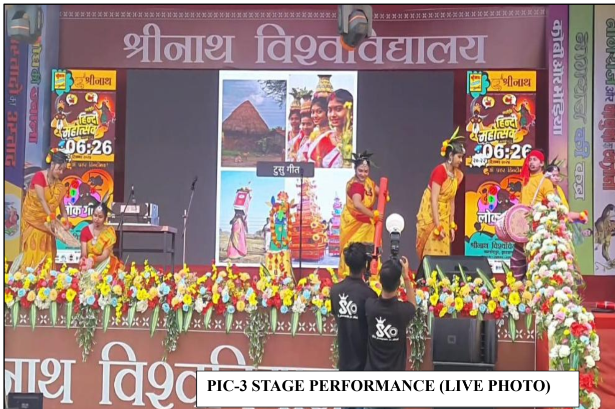
PIC-3 STAGE PERFORMANCE (LIVE PHOTO)

E-mail : dbms.edu23@gmail.com | Website : dbmscollege.in