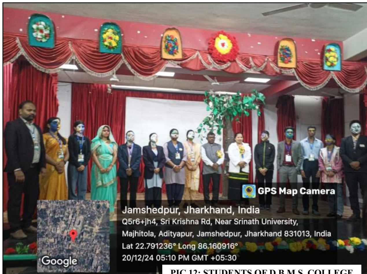
PIC 12; STUDENTS OF D.B.M.S. COLLEGE PARTICIPATED IN HINDI DIWAS AT SRINATH UNIVERSITY

E-mail : dbms.edu23@gmail.com | Website : dbmscollege.in