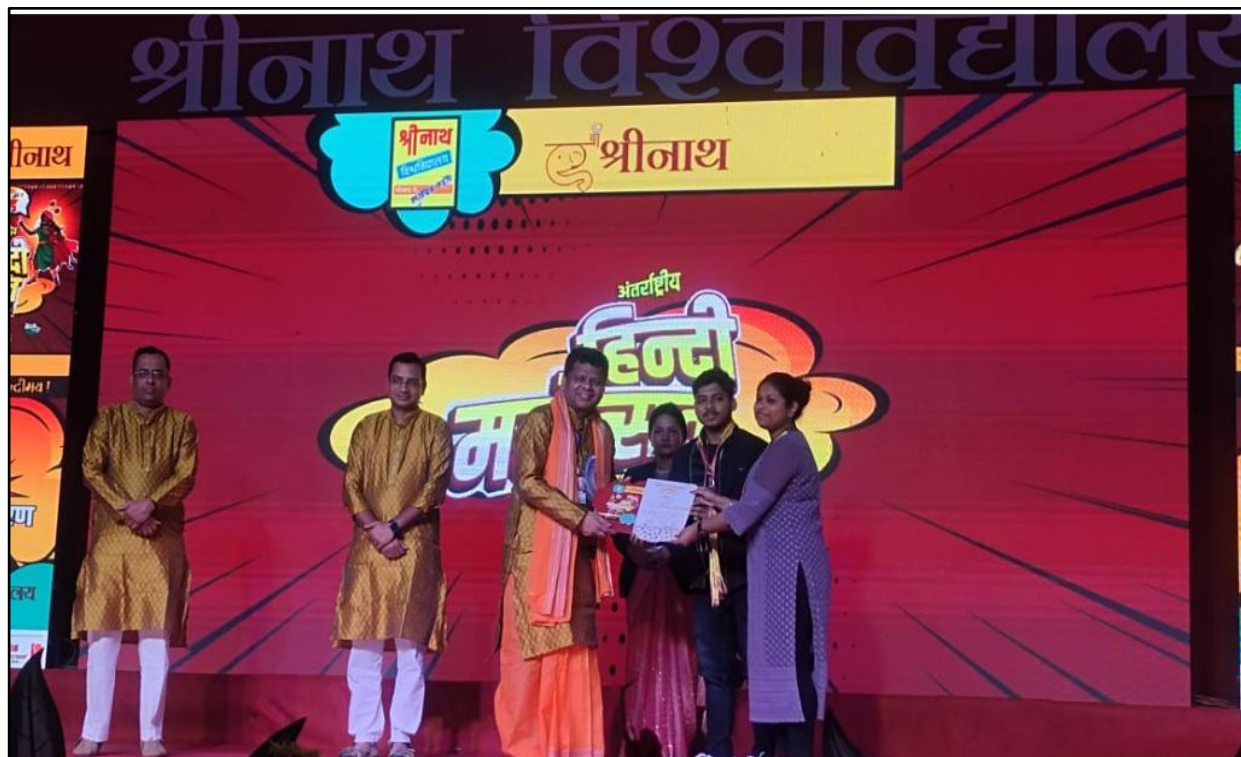
PIC-4 RECEIVING THE PRIZE&CERTIFICATE FROM THE CHAIRPERSON (SRINATH UNIVERSITY)