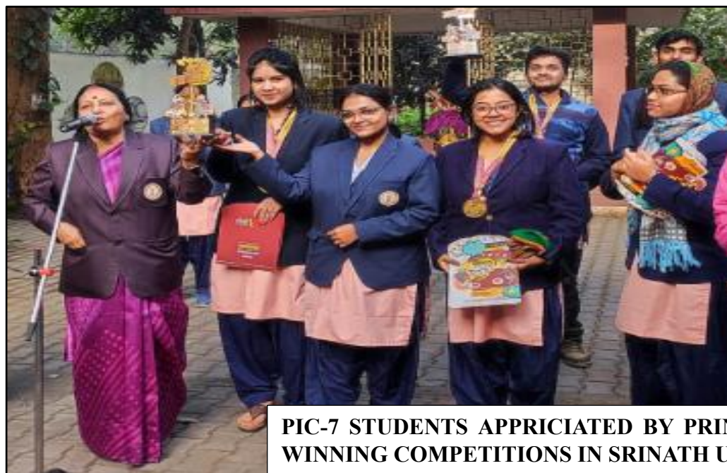
PIC-7 STUDENTS APPRICIATED BY PRINCIPAL FOR WINNING COMPETITIONS IN SRINATH UNIVERSITY