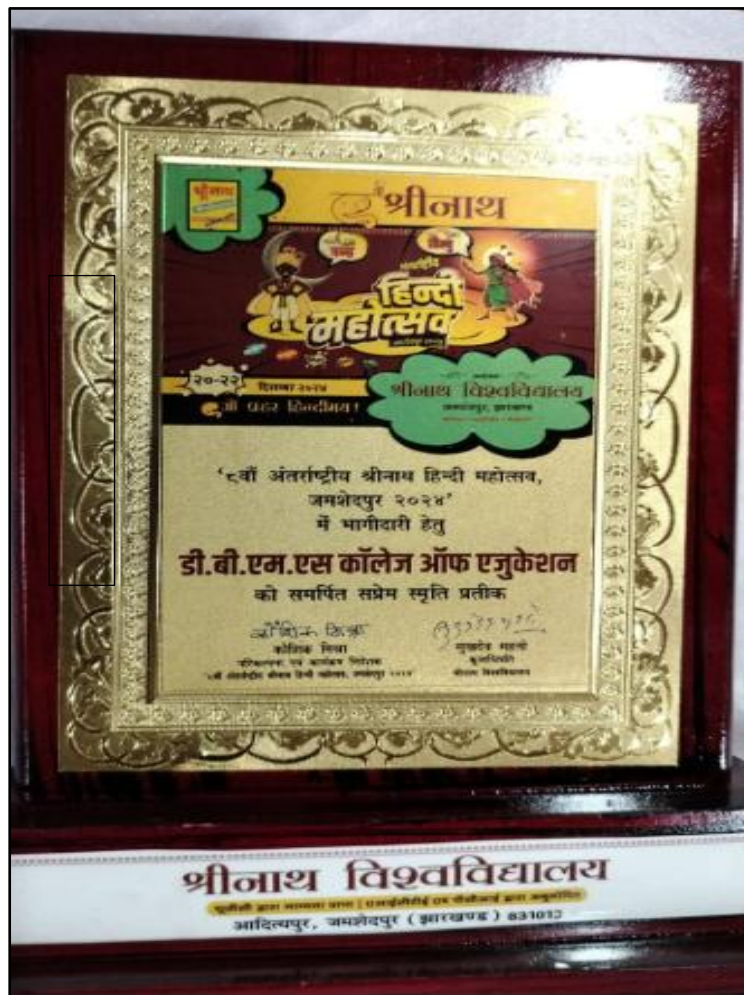
PIC -6 ACHIEVEMENT (MEMENTO)

E-mail : dbms.edu23@gmail.com | Website : dbmscollege.in