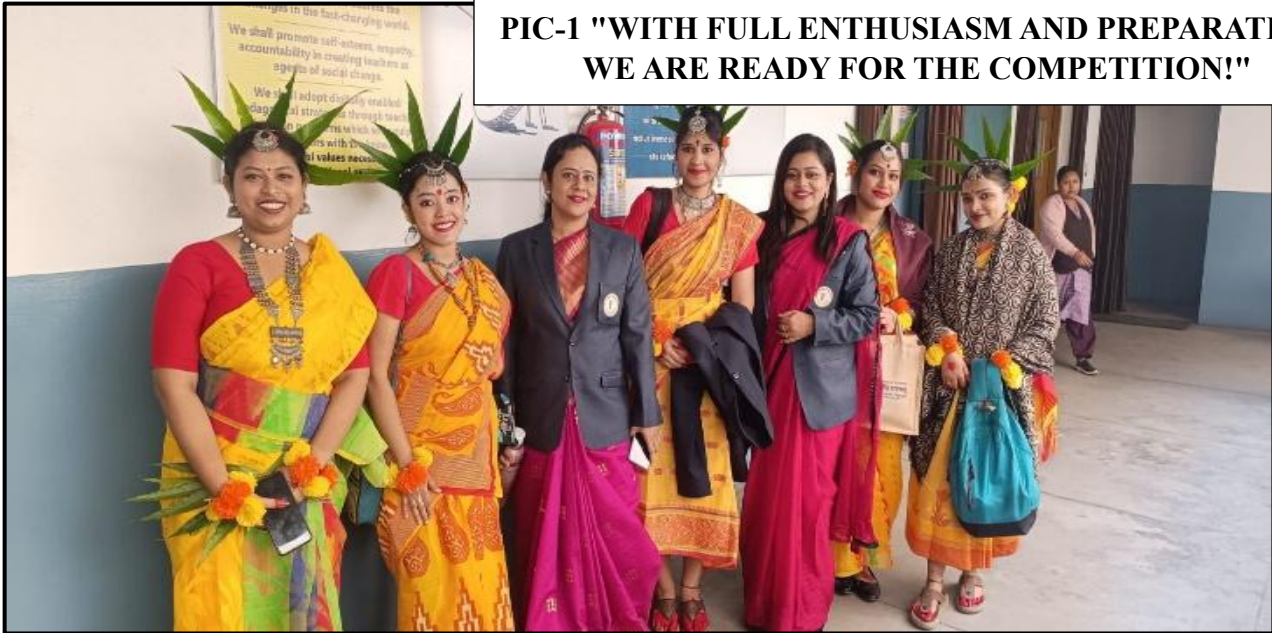
PIC-1 "WITH FULL ENTHUSIASM AND PREPARATION, WE ARE READY FOR THE COMPETITION!"