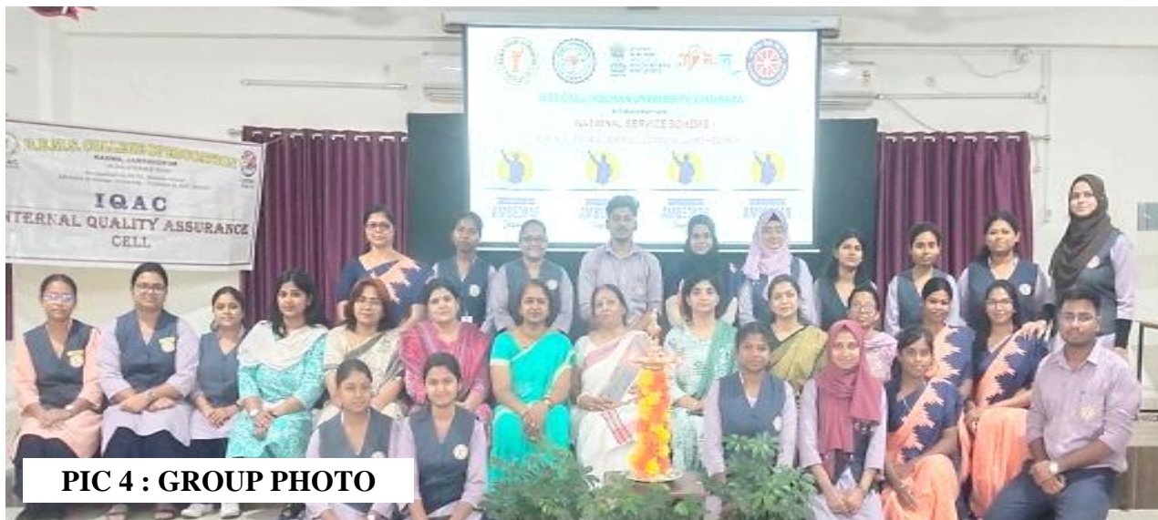
PIC 4 : GROUP PHOTO

E-mail : dbms.edu23@gmail.com | Website : dbmscollege.in