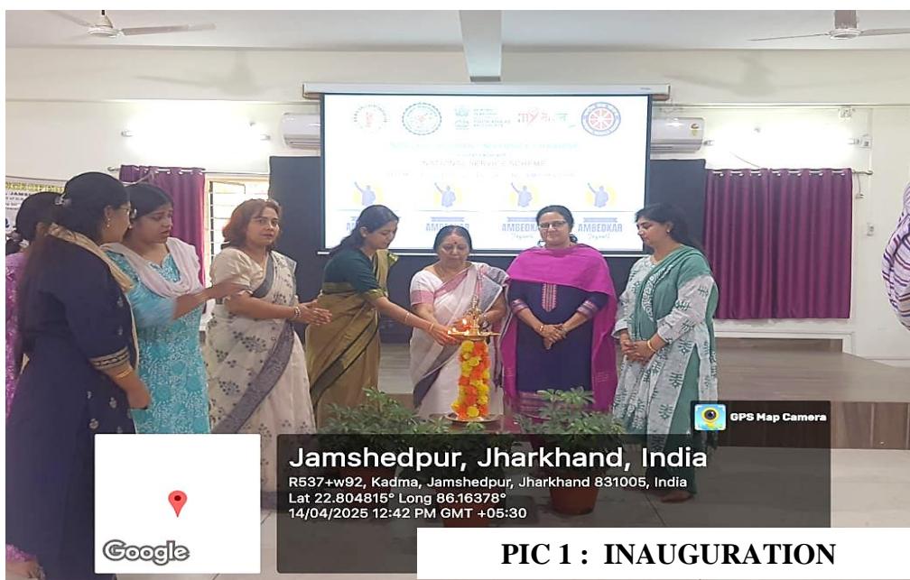
PIC 1 : INAUGURATION